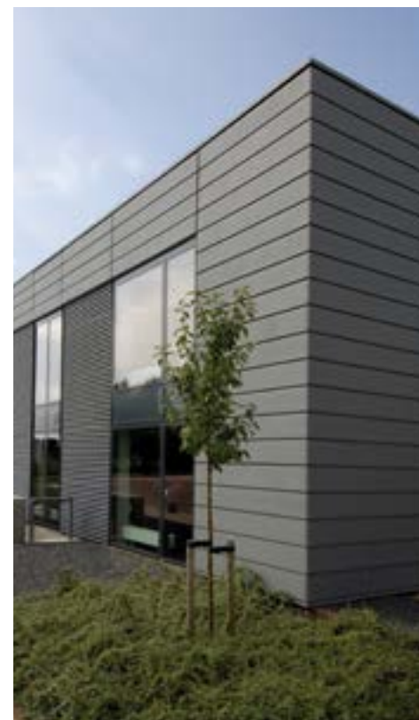
Biuro Kolding (Dania)